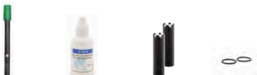
HI764080 Sonda de oxígeno disuelto

Kit edge® para OD: HI2040-01 (115V) y HI2040-02 (230V) incluyen: