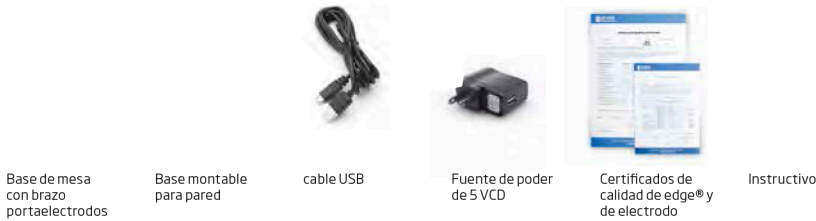
Base de mesa con brazo portaelectrodos