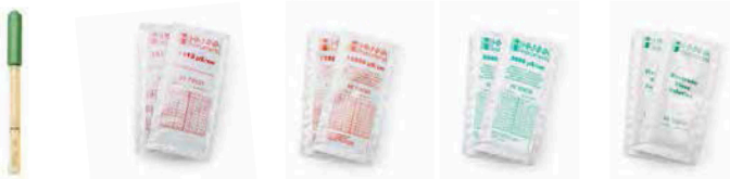
HI763100 Sonda de conductividad

Kit edge® para CE: HI2030-01 (115V) y HI2030-02 (230V):